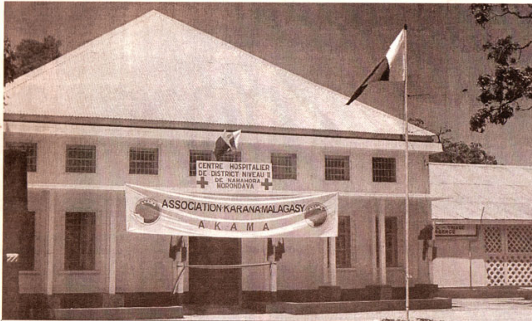
L'hôpital de Namahora